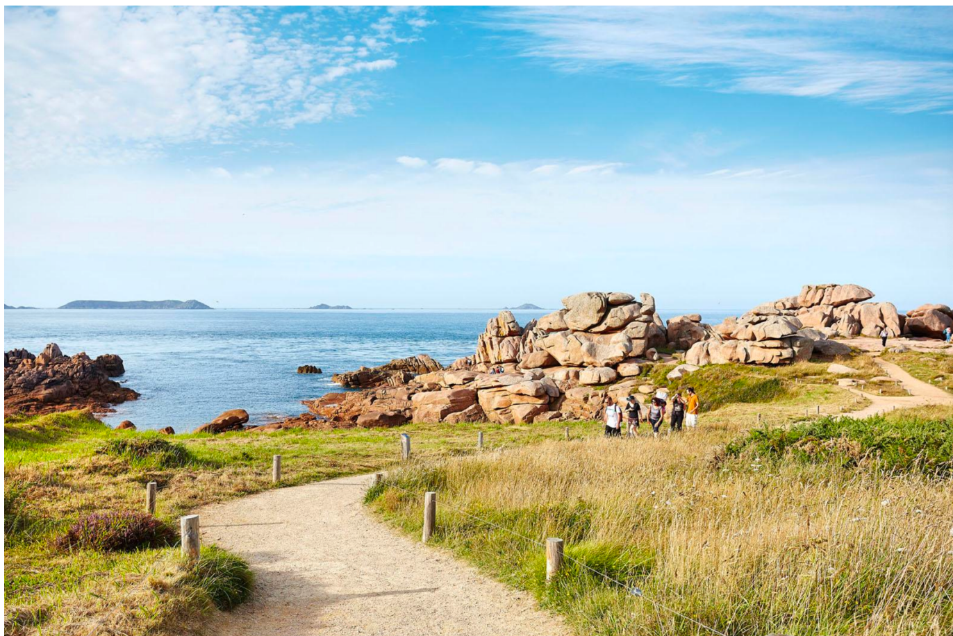
La Côte de Granit Rose et le célèbre GR34 : Le Chemin des Douaniers